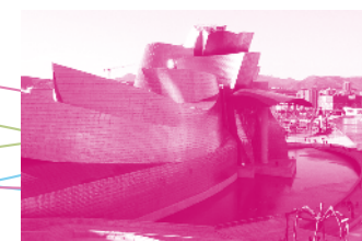
Musée Guggenheim New-York /// Abou Dhabi /// Bilbao