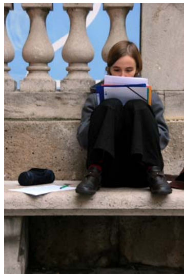
e. Service de la communication

2 rue Rigault 92016 Nanterre 01 41 91 92 50 mdph@mdph92.fr solidarite.hauts-de-seine.net