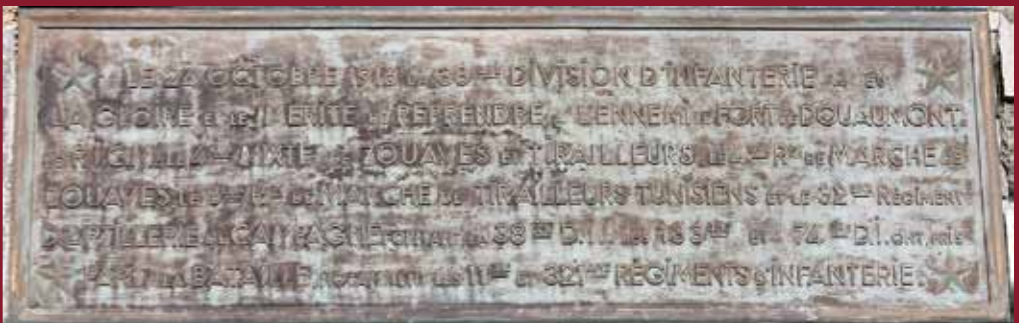
Plaque commémorative de la prise du fort de Douaumont par la 38 e division d'infanterie, 24 octobre 1916.