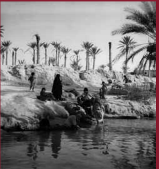
Scène de fleuve, Tozeur (Tunisie), cliché Pierre Boucher (Alliance) pour la direction du Tourisme, vers 1920. Arch. nat., 20000335/41. © Archives nationales (France).