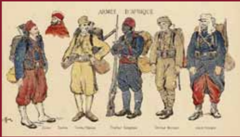
«Tenue de campagne: (...) armée d'Afrique», 1914 Histoire illustrée de la guerre du droit, d'Émile Hizelin, Paris, libr. A. Quillet, 1916, tome 1. Arch. nat., Bibl. hist., 10640/1.

19h30 Bilan et cocktail final (sur invitation) Université de Paris 1–Panthéon-Sorbonne, en présence de son président, Georges HADDAD